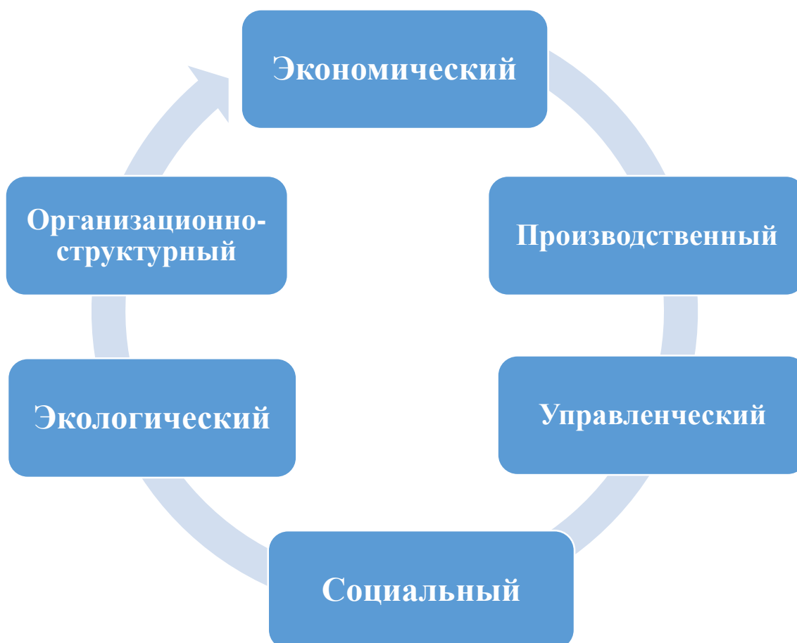
Рисунок 1. Модель потенциала иностранной предпринимательской структуры

Таким образом, в процессе комплексной оценки потенциала иностранной предпринимательской структуры предлагаем рассматривать его производственный потенциал дифференцированно с точки зрения трех его аспектов (рис. 2):