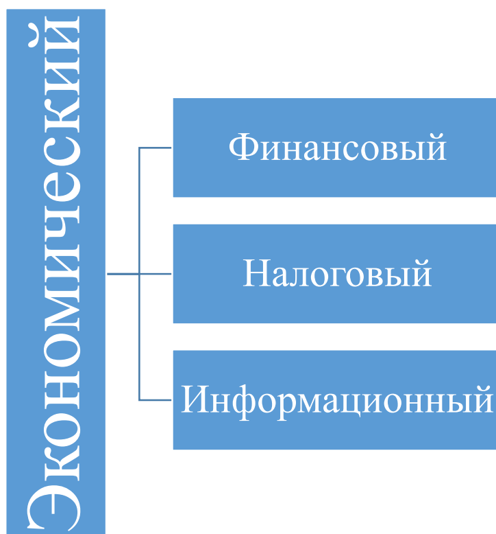
Рисунок 4. Элементы экономического потенциала