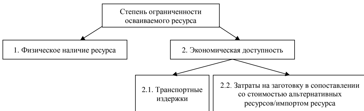
Рисунок 1. Факторы, определяющие степень ограниченности осваиваемого ресурса (составлено авторами)

В указанном примере сформированный платежеспособный спрос, ориентированный на качественные характеристики древесины, позволяет заготовителю допускать значительные издержки, отчасти нивелируя инфраструктурный и технологический факторы: «В период начала лесозаготовки в лесах севера бревна согласно высоким требованиям к качеству не должны были иметь пороков. Малейшие пороки приводили к отбраковке бревен, в этом случае, если они и были вывезены, но работа лесорубов не оплачивалась. При таких ограничениях лесорубы строжайшим образом определяли качество деревьев еще до валки; не ограничиваясь осмотром, выстукивали деревья и при малейшем подозрении внутреннего порока оставляли их на корню. При работе они заготавливали только комлевые бревна» [22].