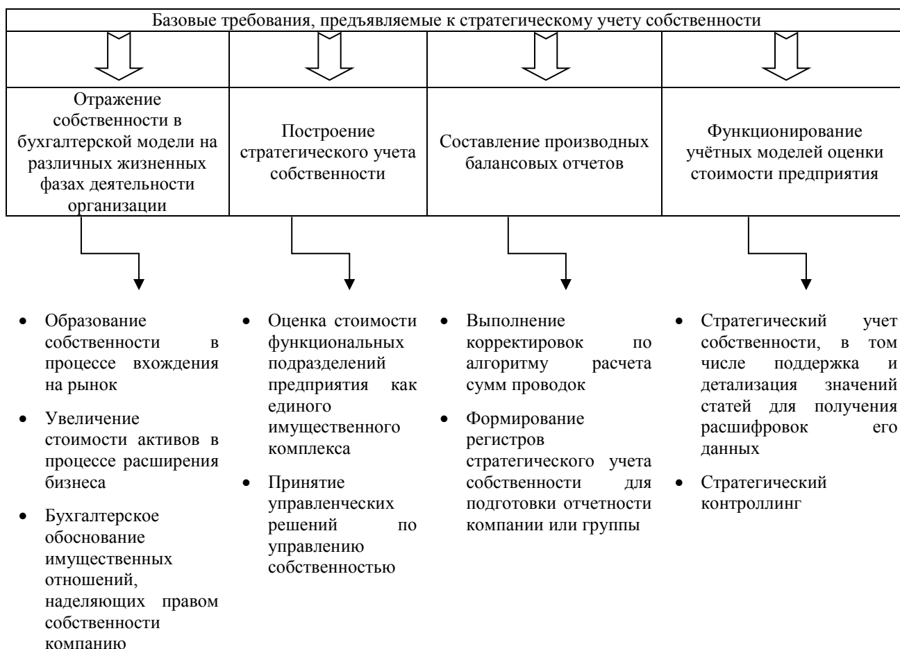
Рисунок 1. Базовые требования, предъявляемые к стратегическому учету собственности (составлено авторами)

Стратегический учет собственности в качестве информационной базы процесса управления ею и оценки стоимости предприятия, следует реализовать через четыре взаимосвязанных блока, что представлено данными рис. 1.