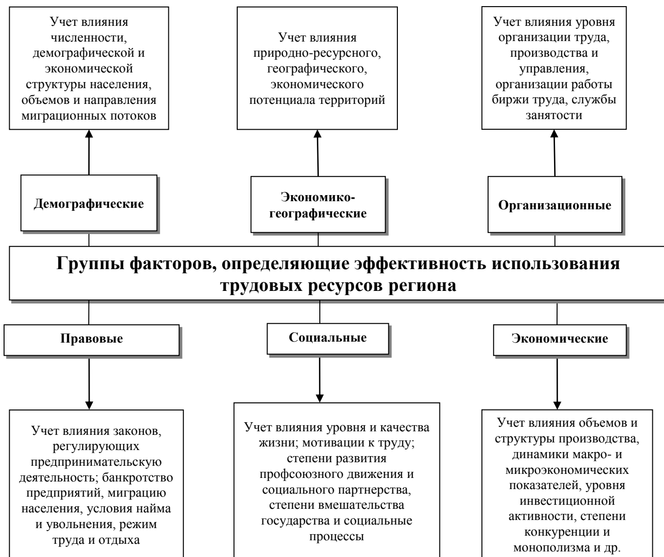
Рисунок 1. Классификация факторов, определяющих эффективность использования трудовых ресурсов в регионе

Логическое обоснование отбора факторов из представленных на схеме групп для корреляционно-регрессионного анализа представлено и систематизировано в таблице 1: