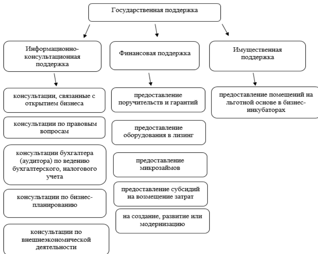
Рисунок 1. Основные направления деятельности государственной программ развития предпринимательства в Самарской области

Одним из наиболее распространенных фондов в Самарской области является «Региональный фонд развития предпринимательства Самарской области», который ориентирован на оказание информационно-консультационной поддержки. Так, в данном фонде проводятся семинары по открытию бизнеса, консультации по увеличению прибыли, юридическому и правовому сопровождению предпринимательской деятельности, организуются круглые столы, тренинги и семинары, планируются встречи и выезды для участия в межрегиональных и всероссийских выставках.