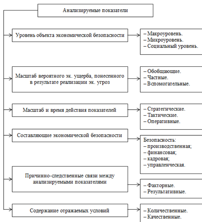
Рисунок 3. Современные инновации в области экономической безопасности организаций (классификация показателей)

Предложенная на основе указанных принципов классификация (рис. 3) позволяет дать комплексную оценку современных инноваций в области экономической безопасности организаций, поскольку охватывает практически всю совокупность воздействующих факторов. Вместе с тем наибольшую значимость для оценки деятельности организаций представляют показатели, классифицированные по масштабу вероятного экономического ущерба, а также по времени действия, поскольку во многом их неустойчивая динамика обусловлена объективными факторами, управление которыми на уровне отдельно взятой организации зачастую усложнено.