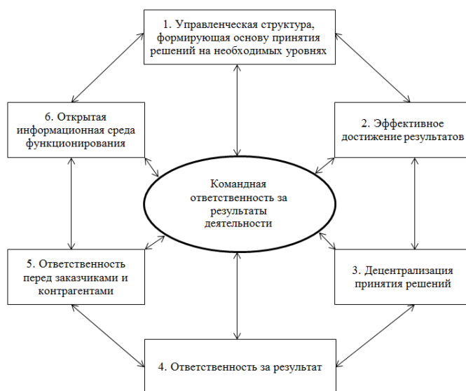
Рисунок 2. Основные принципы построения управленческой структуры внедрения современных инноваций в область экономической безопасности организаций

В современных рыночных условиях обеспечение экономической безопасности организаций становится одной из важнейших задач. Исследования по данной проблеме носят комплексный характер. Современные инновации в области экономической безопасности организаций базируются, во-первых , на создании комплекса условий безопасного функционирования, а во-вторых , на разработке комплексной системы оценки степени их состояния. Содержание концепций экономической безопасности организаций в современных исследованиях обусловлено состоянием экономического субъекта, наиболее эффективно использующего различные экономические ресурсы с целью противодействия экономическим угрозам или ослабления их воздействий, а также достижения целей той или иной организации. По этой причине основное внимание уделяется совершенствованию системы управления организацией, а именно разработке основ развития интеллектуального потенциала, построения эффективной управленческой структуры, которая должна опираться на принципы, позволяющие обеспечить конкурентное преимущество (рис. 2).