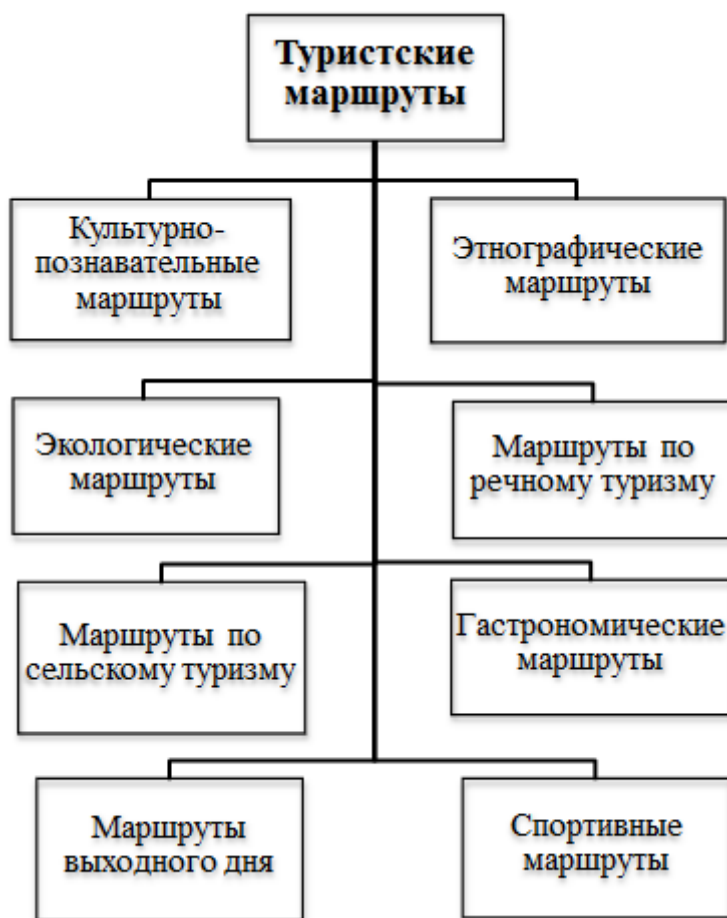
Рисунок 2. Классификация туристских маршрутов Самарской области, привлекательных для посещения студенческой молодежью (составлено авторами)

информационные базы и каталоги туристского информационного центра Самарской области 13 .