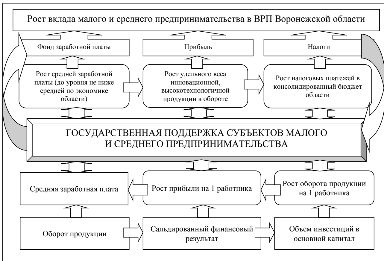
Рисунок 3. Методический подход к оценке уровня развития малого и среднего предпринимательства в сфере обрабатывающей промышленности

На рисунке 3 приведена система показателей, позволяющих произвести комплексную оценку уровня развития малого и среднего предпринимательства в сфере обрабатывающей промышленности, в том числе в качестве инновационной среды для развития технопарков [1, с. 91-92].