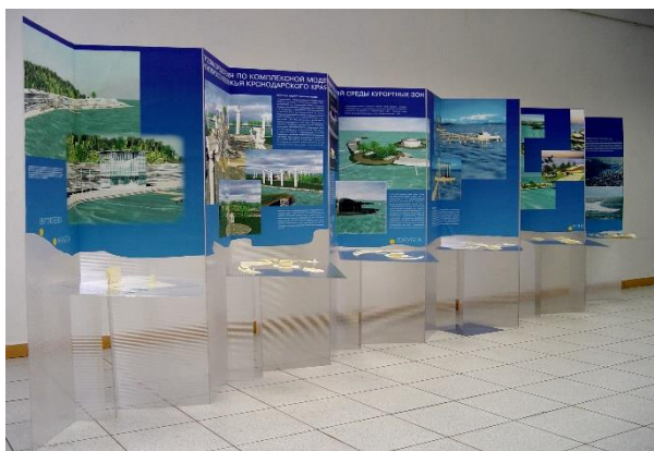
Рисунок 3. Инсталляция «Предложения по проектной концепции дизайн-программы», выполненной группой студентов под руководством автора