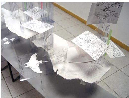
Рисунок 1. Фрагмент инсталляции «Предпроектное исследование по дизайн-программе», выполненной группой студентов под руководством автора