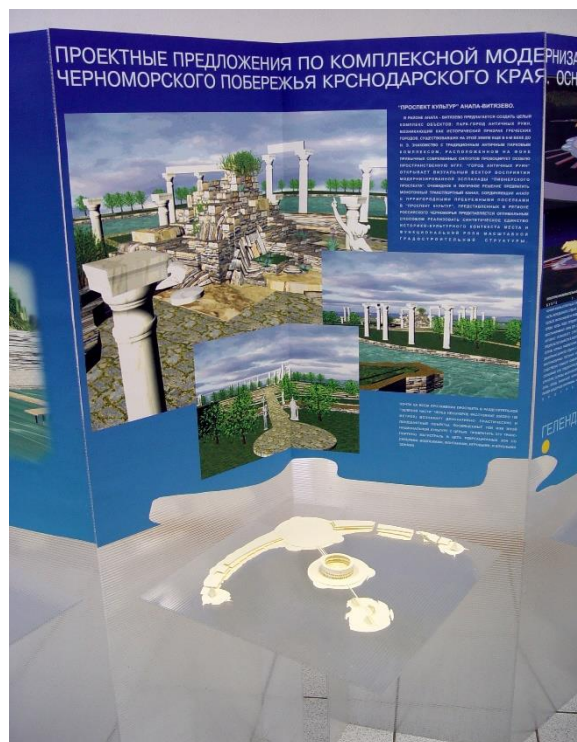
Рисунок 4. Фрагмент инсталляции «Предложения по проектной концепции дизайн-программы», выполненной группой студентов под руководством автора

Дизайн-программа модернизации курортной среды Черноморского побережья и прибрежных районов Краснодарского края позволит объединить и сконцентрировать организационные, инвестиционные, производственные ресурсы региона на решении ряда актуальных задач курортно-туристической отрасли по формированию совершенной, во всех отношениях комфортной, гармоничной «Среды Отдыха». Дизайн-программа сможет стать интеграционным фактором в процессе давно назревшей модернизации туристической отрасли региона и актуализирует наиболее острые проблемы отечественной индустрии досуга.