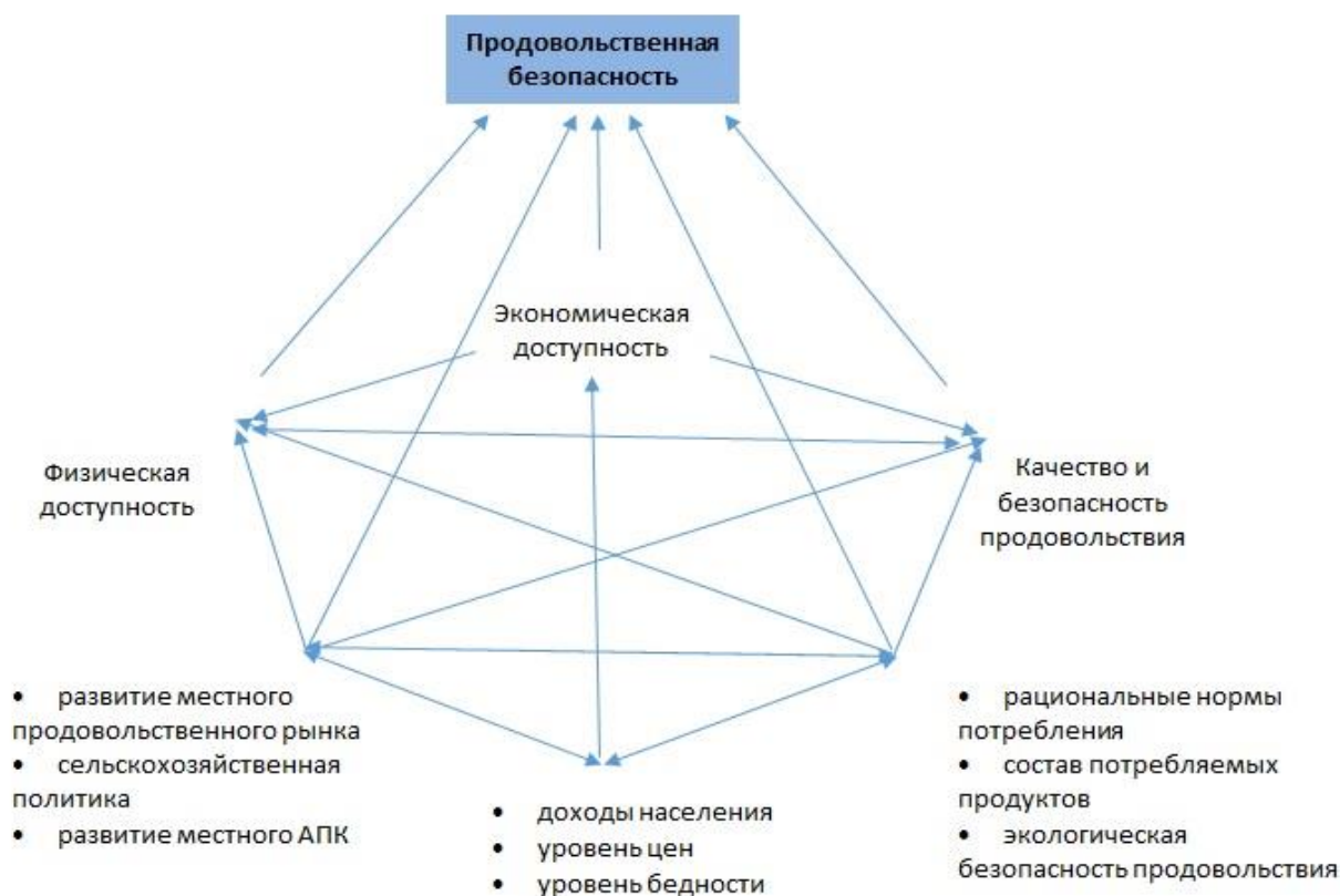
Рисунок 3. Взаимосвязи факторов, оказывающих влияние на формирование продовольственной безопасности (прим. составлено автором)

Физическая, экономическая доступность продовольствия и качество продуктов питания как компоненты продовольственной безопасности обнаруживают тесные связи с развитием АПК, состоянием рынка, уровнем благосостояния населения (рис. 3).