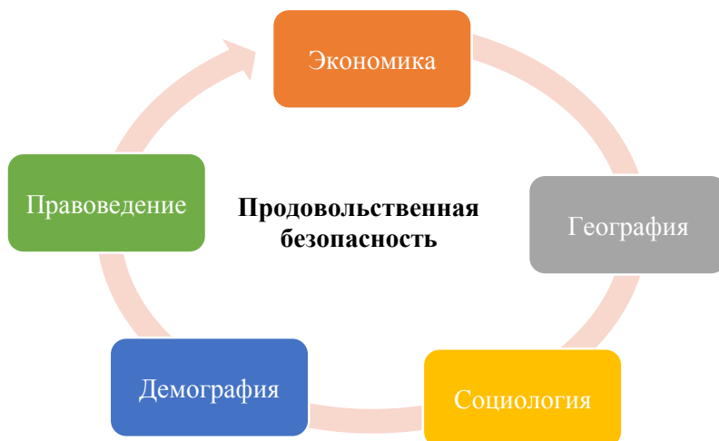
Рисунок 1. Продовольственная безопасность как объект исследования (прим. составлено автором)

Проблему продовольственной безопасности сложно отнести к какой-либо одной дисциплине – она является междисциплинарной, многоуровневой и многоаспектной. Ее изучение требует интеграции подходов нескольких дисциплин: экономики, географии, социологии, демографии, правоведения (рис. 1).