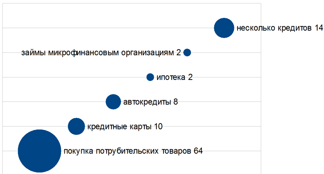
Рисунок 2. Структура потенциальных банкротов-граждан, % (рисунок авторов)

На сайте «Банкрот Консалт» приводятся данные в соответствии с которыми за год в Арбитражные суды было подано почти 35 тысяч заявлений. По подсчетам Общества содействия финансовому оздоровлению Finzdog.ru (анализирует картотеку решений арбитражных судов, реестры арбитражных управляющих), по состоянию на 1 декабря 2016 года было открыто 21284 дела, приняты решения о реализации имущества - 15125, процедура реструктуризации проводится по 6159 делам и только 1009 человек с начала действия закона о банкротстве физических лиц смогли списать свои долги. Только в семнадцати регионах количество завершенных дел превышает десяток (от 12 до 26). Очевидно, что социально-экономическим назначением Закона «О банкротстве физических лиц» является реструктуризация долга, но как видим такое решение было принято менее чем в 29 процентах дел, находящихся на рассмотрении в Арбитражных судах. На взгляд экспертов такая ситуация объясняется не только низкими доходами граждан (заработная плата от 10 до 15 тысяч рублей), но прежде всего, нежеланием кредиторов предоставлять длительные рассрочки на погашение долгов 4 .