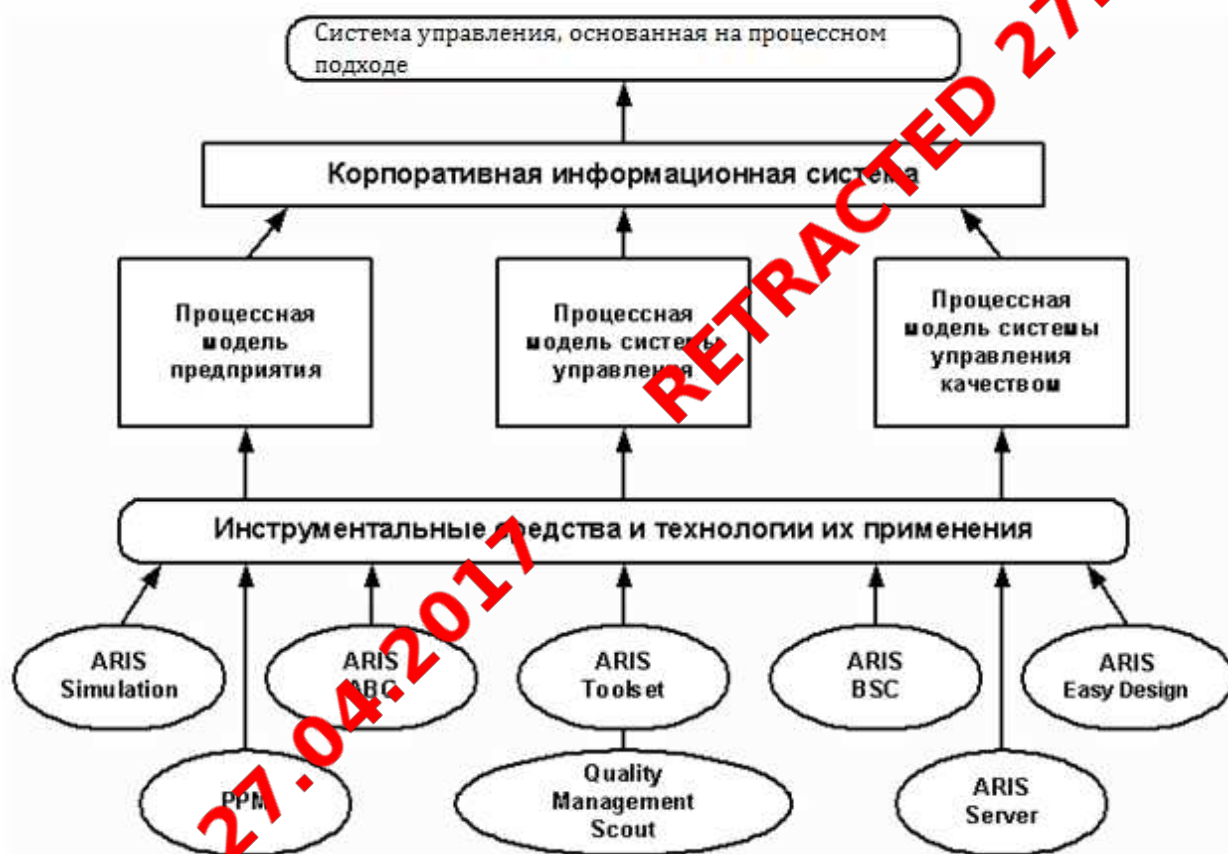
Рис.2. Общий вид системы управления, построенной на процессном подходе к управлению 11

Классические ERP-системы, в отличие от так называемого «коробочного» программного обеспечения, относятся к категории «тяжёлых» программных продуктов, требующих достаточно длительной настройки для того, чтобы начать ими пользоваться. Выбор ERP-системы, приобретение и внедрение, как правило, требуют тщательного планирования в рамках длительного проекта с участием партнёрской компании — поставщика или консультанта. Поскольку ERP-системы строятся по модульному принципу, заказчик часто (по крайней мере, на ранней стадии таких проектов) приобретает не полный спектр модулей, а ограниченный их комплект. В ходе внедрения проектная команда, как правило, в течение нескольких месяцев осуществляет настройку поставляемых модулей.