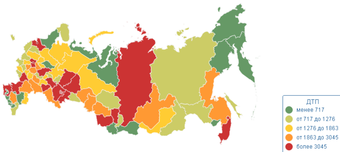
Рис. 1. Распределение уровня аварийности на территории России

Уровень аварийности по регионам России представлен на рис. 1.