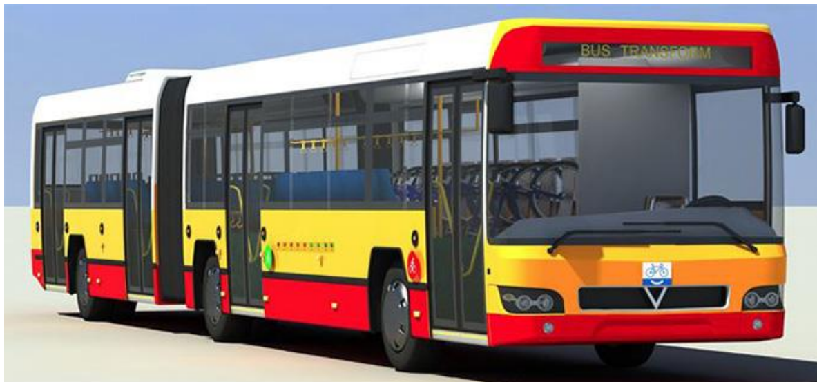
Рисунок 1. Автобус серии МАЗ 107, выбранный для модернизации (рисунок авторов)

Для разработки низкопольного удлиненного одноэтажного автовелобуса с отдельной секцией для велосипедов выбран самый длинный автобус серии МАЗ 107 (рис. 1). По разработанной методике обоснования параметров автовелобуса с учетом особенностей конкретного маршрута. Автобус имеет длину 13,7 м, что соответствует. Автобус имеет высоту 4,1 м, что допустимо в большинстве городов.