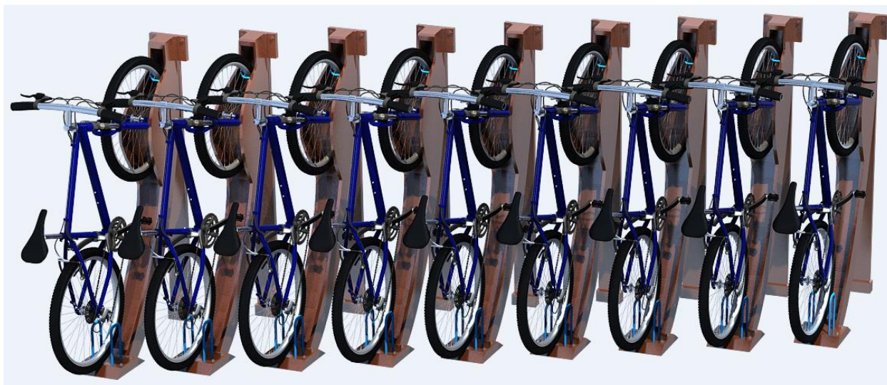
Рисунок 3. Схема крепления велосипеда в автобусе (рисунок авторов)

Система крепления можно использовать с различными диаметрами колёс и ободьев. В комплекте крепления есть всё необходимое для лёгкой инсталляции, которая должна занять не более 30 секунд. Максимальная грузоподъёмность крепления составляет до 30 кг. Заднее колесо касается пола автобуса. При установке велосипеда пассажиру нужно немного поднять велосипед и катать его по направляющей стойки. Для того чтобы велосипед крепко держался его переднее колесо вешается на крючок. Стойки ограничивают перемещение велосипеда в салоне при разгоне и торможении автобуса [5].