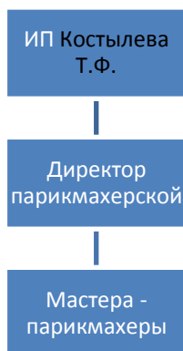
Рис. 2 - Схема управления парикмахерской «Магия»

Управление предприятием представляет собой простую двухуровневую линейную структуру подчинения как это в показано на рисунке 2.