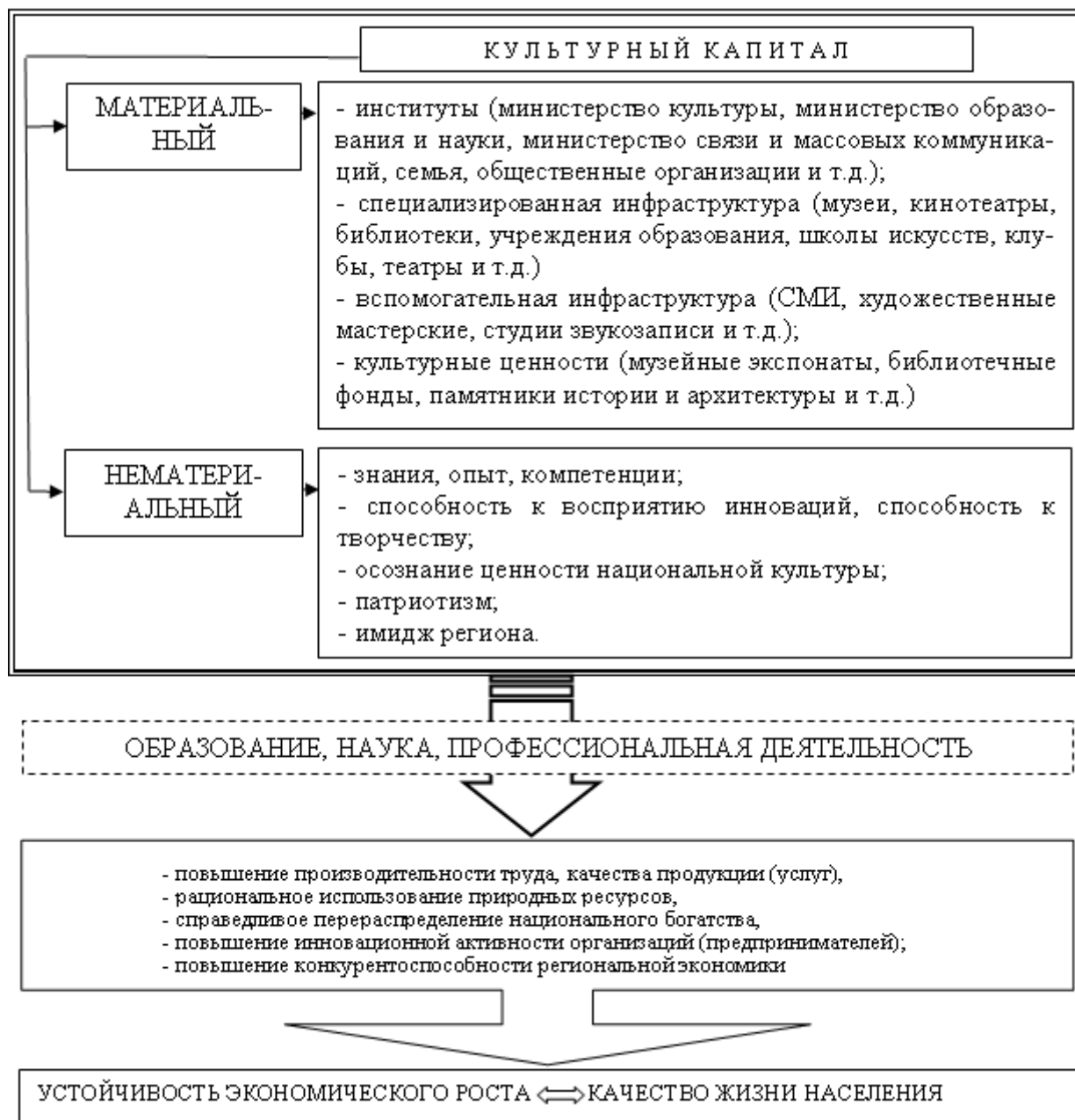
Рисунок 1. Влияние культурного капитала региона на устойчивость экономического роста и качество жизни населения

нематериальные активы (знания, компетенции, способность к восприятию инноваций и др.). Статистически эти активы можно измерить косвенно: например, способность к восприятию инноваций – оценить на основе федерального статистического наблюдения за инновационной активностью организаций, имидж региона – на основе упоминаний региональных достижений в СМИ.