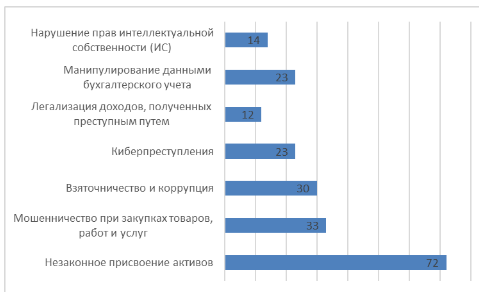
Рисунок 1. Оценка актуальности угроз (%) по мнению экспертов PwC 5

По оценкам компании наибольший удельный вес в структуре экономических преступлений занимают: незаконное присвоение активов, мошенничество при закупке товаров, взяточничество и коррупция, что и представлено на рисунке 1.