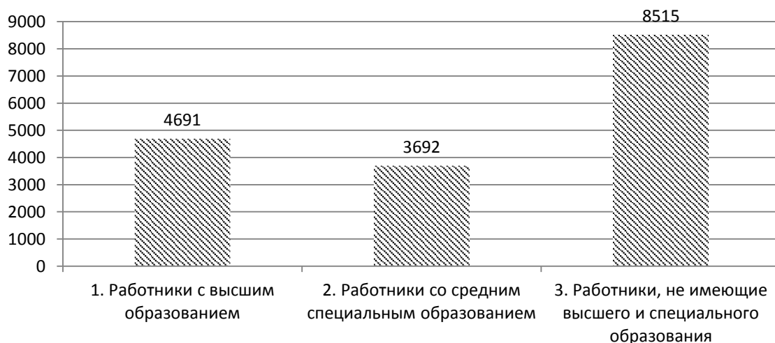
Рис. 2. Потребность предприятий Новосибирской области в работниках по объединенным категориям (чел)

В результате формирования данных категорий получим следующие данные о потребности предприятий Новосибирской области в 2013 году (рис 2):