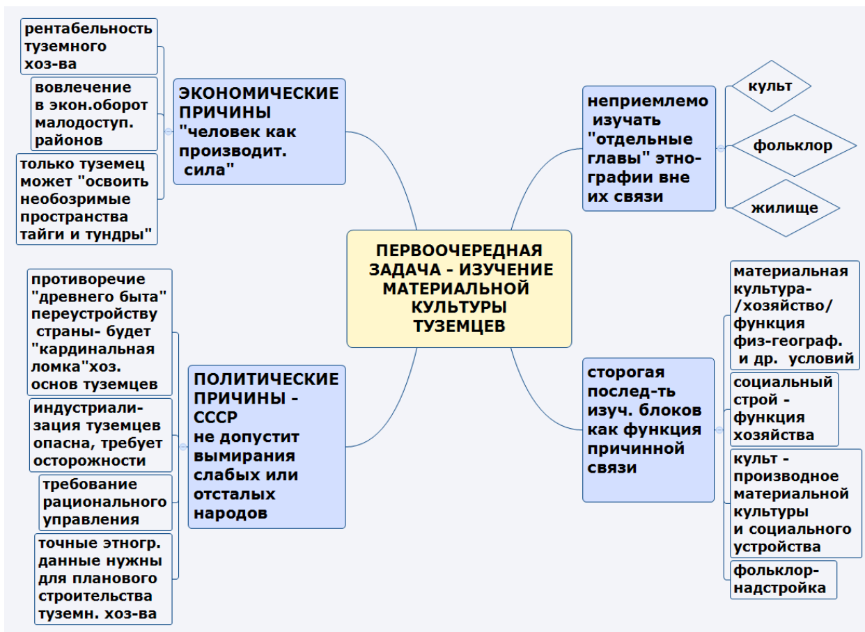
Рисунок 1. Причины и особенности изучения экономического строя сибирских народов (составлено автором по [15]).

преувеличивалась. Триада преобразования туземного хозяйства включала: политические цели (для управления «разрозненной туземной массой»), экономические ориентиры (рентабельность и эффективность хозяйства), протекционистские намерения (защита угодий туземцев от «пришлого элемента», нерушимость «национальных квартир» каждого этноса) [18]. Причины первоочередности изучения экономики сибирских народов обозначил Б.Э. Петри [15] (Рисунок 1).