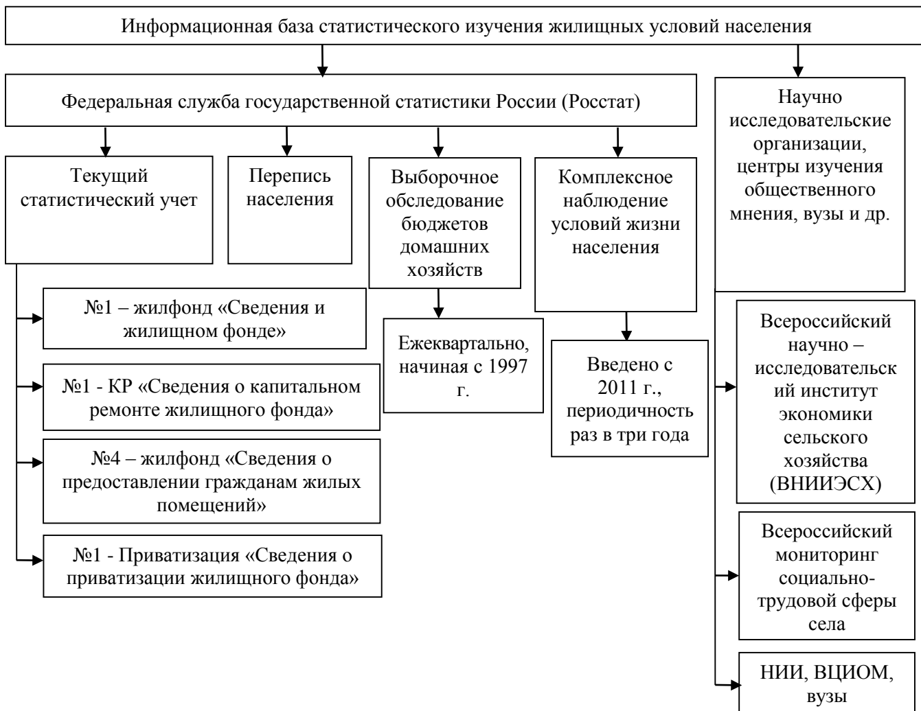
Рисунок 1. Информационная база статистического изучения жилищных условий населения

Показатели, характеризующие жилищные условия населения, формируются на основе годовых форм федерального статистического наблюдения: №1-жилфонд «Сведения о жилищном фонде», №4-жилфонд «Сведения о предоставлении гражданам жилых помещений», №1-КР «Сведения о капитальном ремонте жилищного фонда», №1-приватизация (жилье) «Сведения о приватизации жилищного фонда». Информация Росстата позволяет осуществить комплексную оценку уровня жизни населения регионов РФ, а также получить информацию о дифференциации жилищных условий населения в разных регионах страны. Важным источником информации о жилищных условиях является перепись населения. В 1989 г. при последней переписи населения в СССР впервые были собраны сведения о жилищных условиях населения. Перепись позволила получить сведения о жилищных условиях различных социально-демографических групп населения, о развитии жилищной кооперации, об обеспеченности населения жильем и его благоустройстве [6, 10, 17].