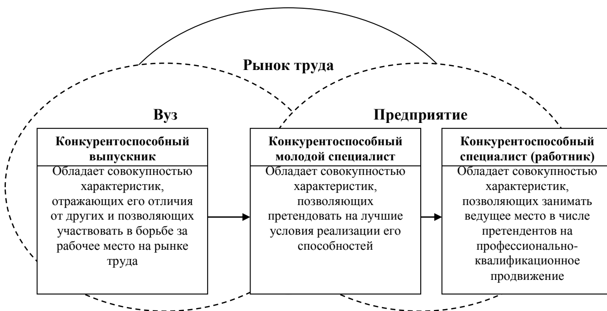
Рисунок 2. Процесс создания конкурентоспособного специалиста (составлено (разработано) автором)