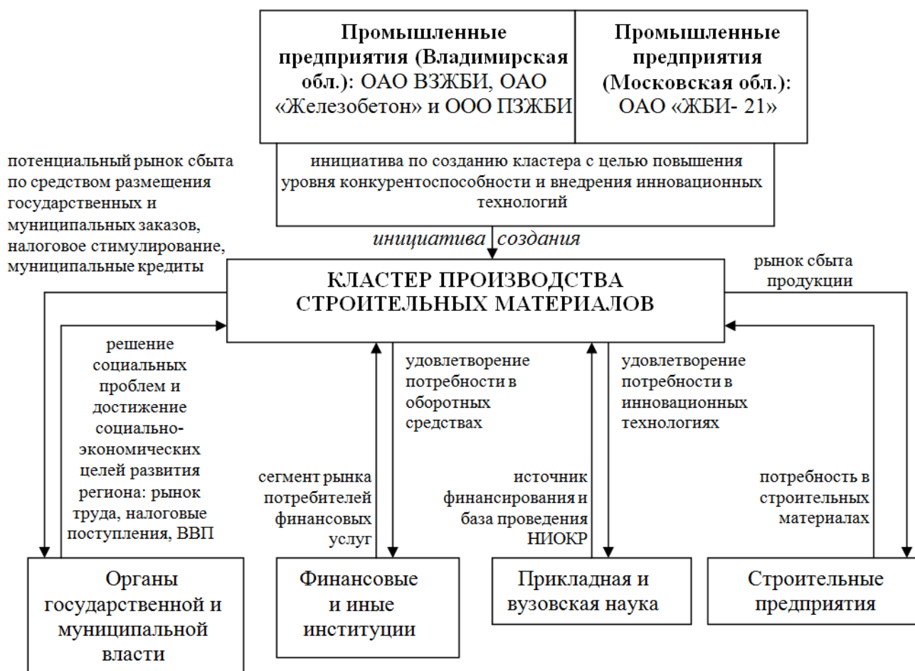
Рис. 1. Место регионального промышленного кластера в процессе удовлетворения потребностей субъектов хозяйствования и органов власти на региональном уровне

Преимуществом кластера также является эффект охвата, возникающий при существовании фактора производства, который может быть использован одновременно для производства нескольких видов продукции. Этот фактор характеризуется многофункциональной природой. При группировке фирм в кластеры эффект охвата значительно усиливается, так как возникает возможность использовать многофункциональный фактор на различных предприятиях при минимизации транзакционных издержек, связанных с его передачей [3, с. 8].