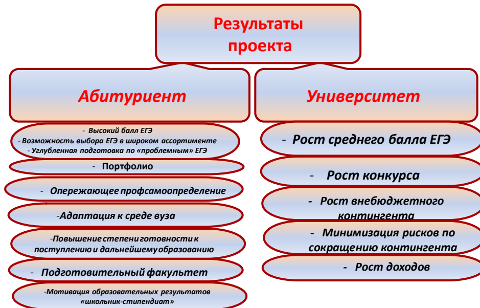
Рисунок 2. Результаты проекта «Steps to Professional»

Эффективность приемной кампании, реализуемой через проект «Steps to Professional», оценивается результатами проекта, представленными на рисунке 2 (составленном автором).