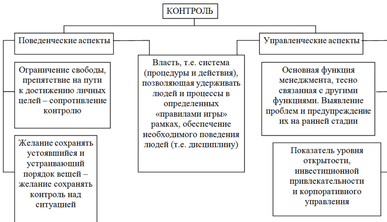
Рис. 2. Проявление контроля в системе социально-экономических отношений [5, с.12]

Как видно, сопротивление к контролю вытекает из самой сущности людей, как психофизиологических субстанций. [5, с.3]