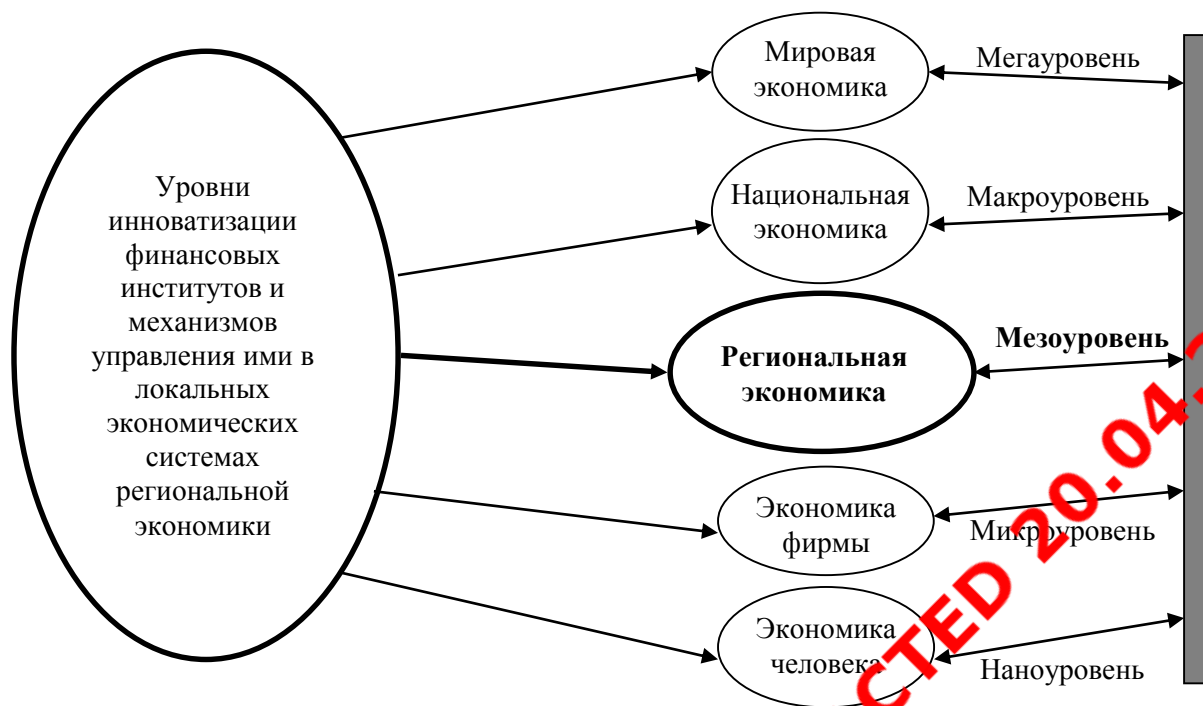
Рис. 1. Приоритеты инновационного развития институтов и механизмов управления ими в локальных экономических системах [8]

В современных локальных экономических системах региональной экономики России складывается определенная специфика функционирования институтов и механизмов управления ими.