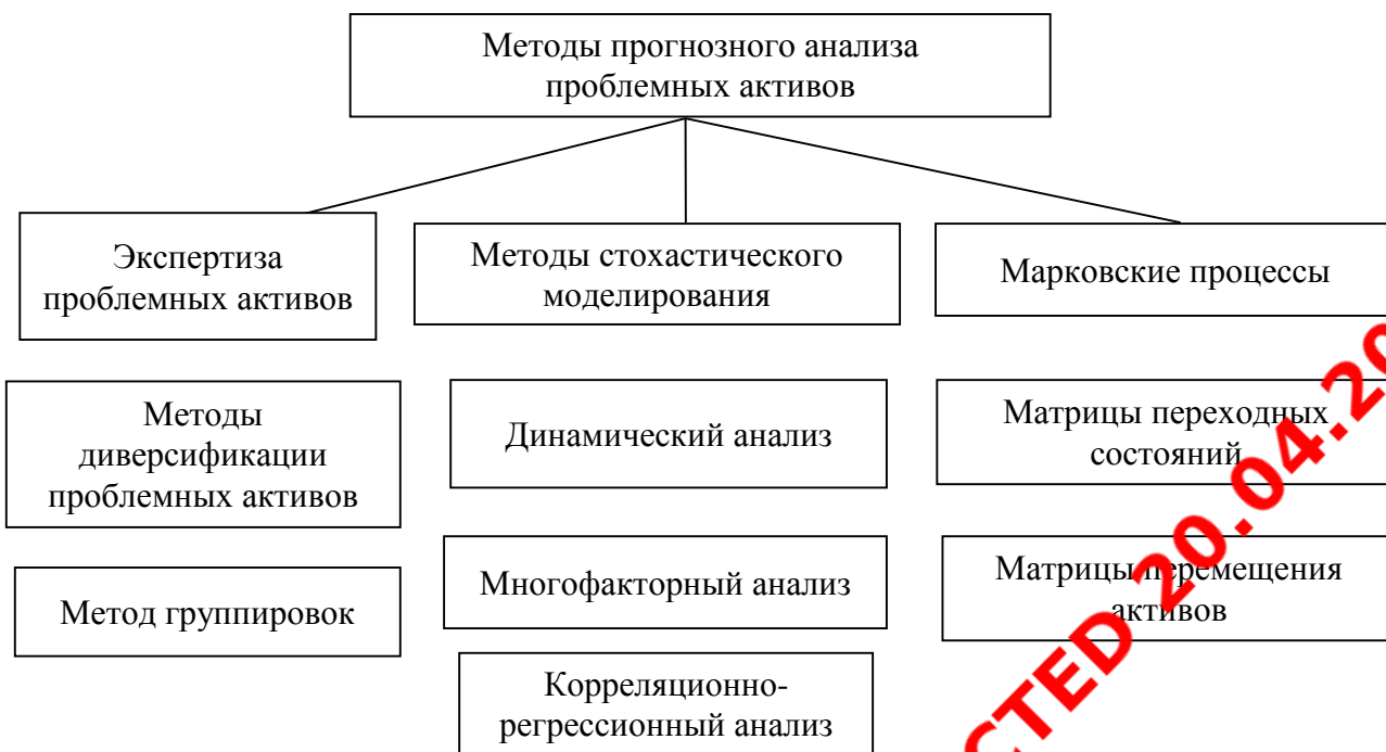
Рис. 2. Классификация методов прогнозного анализа проблемных активов [3]

Особое значение в методах прогнозного анализа играет вычисление трендов циклического колебания, которые, как показано на рисунке 3, тесно взаимосвязаны с циклами деловой экономической конъюнктуры и прогнозами вероятности банкротств в региональных экономических системах.