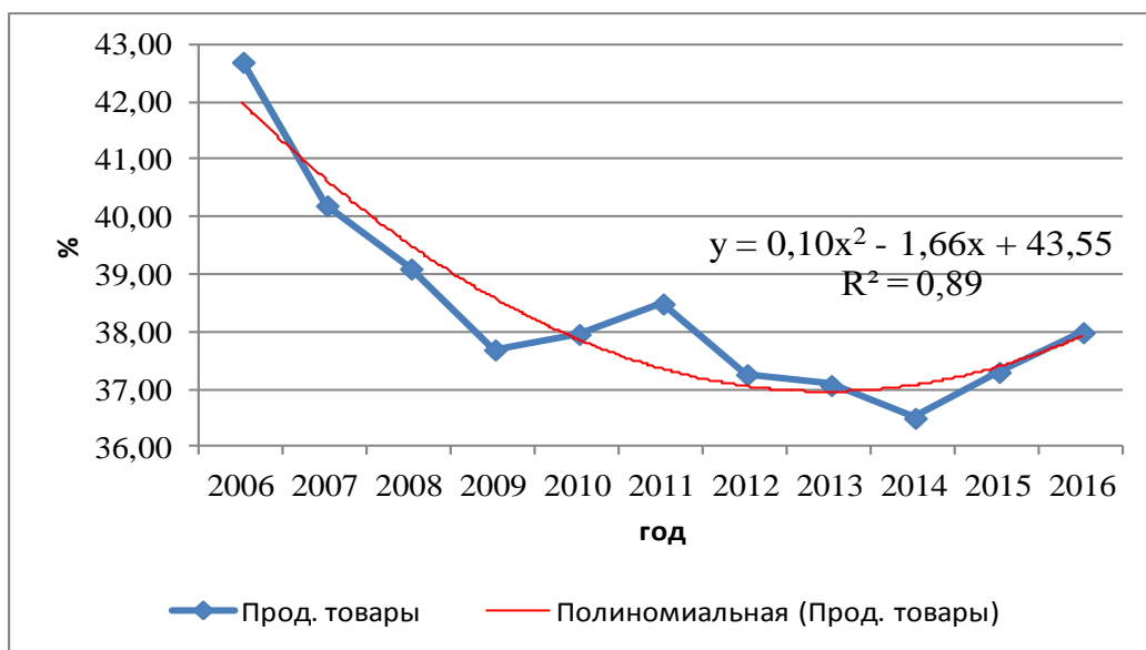
Рисунок 1. Динамика доли продовольственных товаров в структуре потребительских расходов (составлено автором по данным Росстата)

Процентное соотношение доли продовольственных товаров в структуре потребительских расходов характеризует уровень жизни населения. Изучив этот показатель в период с 2006 по 2014 мы видим (рис. 1) снижение доли затрат на продовольственные товары в структуре потребления. Но с 2014 данный показатель увеличивается и к 2016 г. затраты на продовольственные товары достигли уровня 2011 г. Для описания изменения данного показателя используем эконометрическую модель временного ряда. Визуально проанализировав изменение признака, мы предполагаем, что наилучшей моделью для временного ряда будет квадратичная функция вида: y = b_2t^2 + b_1t + a . В качестве переменной (y) возьмем долю продовольственных товаров, в качестве переменной (t) момент времени. В результате оценивания параметров a, b 1 , b 2 методом наименьших квадратов, получили модель тренда, представленную на рисунке 1.