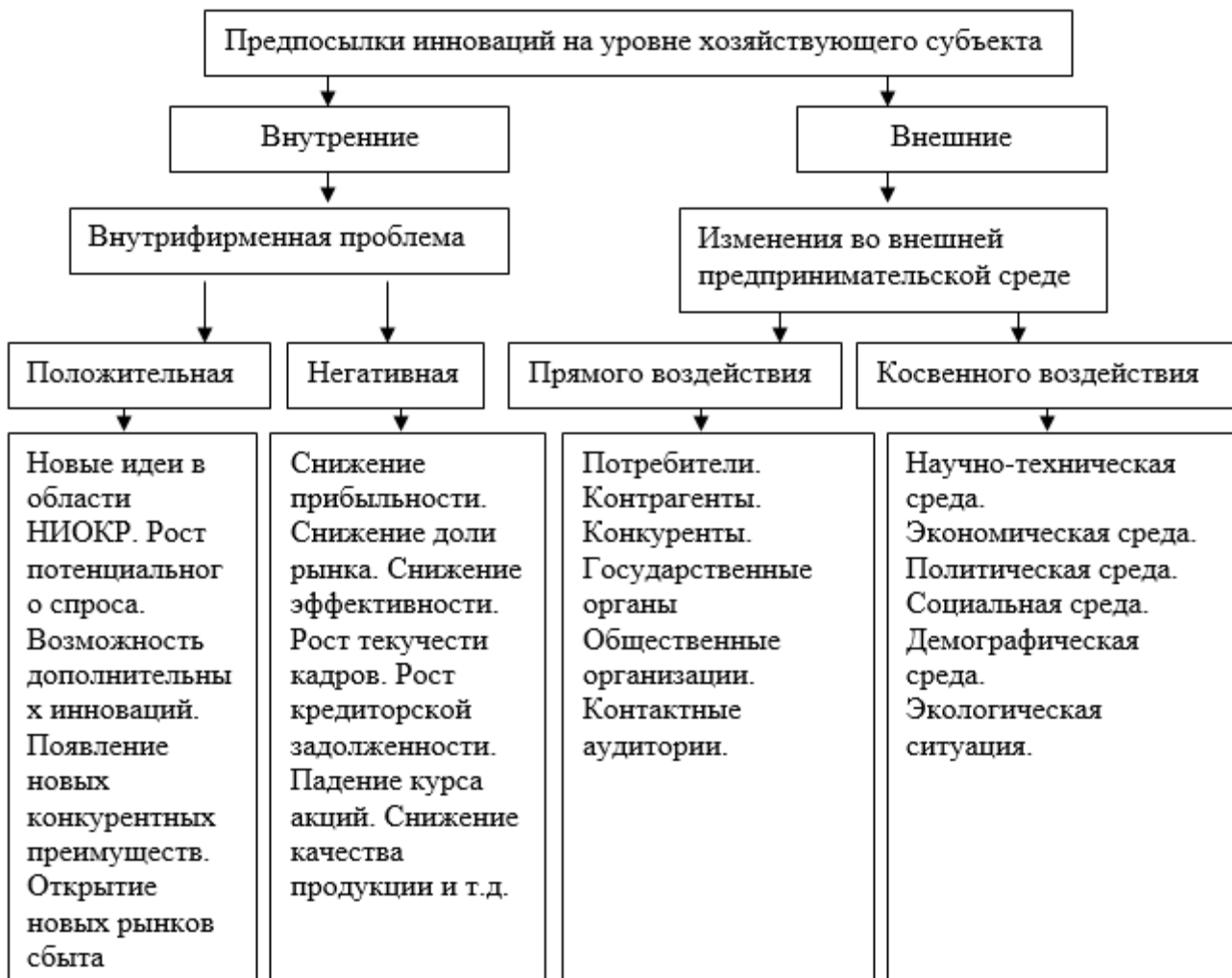
Рис. 1. Предпосылки инновационной деятельности на уровне хозяйствующей организации

Каждая организация в своей жизни проходит различные стадии развития хозяйственной и инновационной деятельности. Период времени между граничными точками возникновения и прекращения деятельности организации принято называть его жизненным циклом. Несмотря на большое разнообразие форм и видов хозяйствующих субъектов, определенные фазы в их жизненном цикле являются достаточно общими и включают фазы возникновения, развития, роста, зрелости и затухания. Для инновационных малых предприятий характерна циклическая повторяемость этих фаз, связанная каждый раз с освоением инноваций. Для каждой фазы хозяйственной жизни малого предприятия, ведущего инновационную деятельность, характерны определенные организационно-экономические условия, выражающиеся в типичных формах финансирования, характере выбираемой отрасли, ценовой политике, поведении на рынках, организационной структуре, масштабах деятельности, глубине специализации и пр. Поэтому для каждого предприятия очень важно идентифицировать фазу своего развития, определить наиболее адекватные формы хозяйствования в каждом периоде своего жизненного цикла.