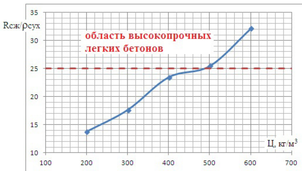
Рис. 1. Зависимость отношения прочности при сжатии ЛСУБ (МПа) к его плотности ( \text{кг/дм}^3 )

Как следует из данных таблицы №1, были изготовлены пять составов с различным содержанием цемента от 200 до 600 \text{кг/м}^3 . Плотность затвердевшего бетона в сухом состоянии варьировалась в пределах от 1745 до 1793 \text{кг/м}^3 . В соответствии с российскими (ГОСТ 25820) и европейскими (EN 206) нормативными документами полученные бетоны относятся к легким бетонам (плотность менее 2000 \text{кг/м}^3 ). При этом, по Ю.М. Баженову, легкие бетоны можно отнести к высокопрочным, если отношение прочности при сжатии бетона (МПа) к его плотности ( \text{кг/дм}^3 ) больше 25. Зависимость этого отношения от расхода цемента в условиях эксперимента приведены на рисунке 1.