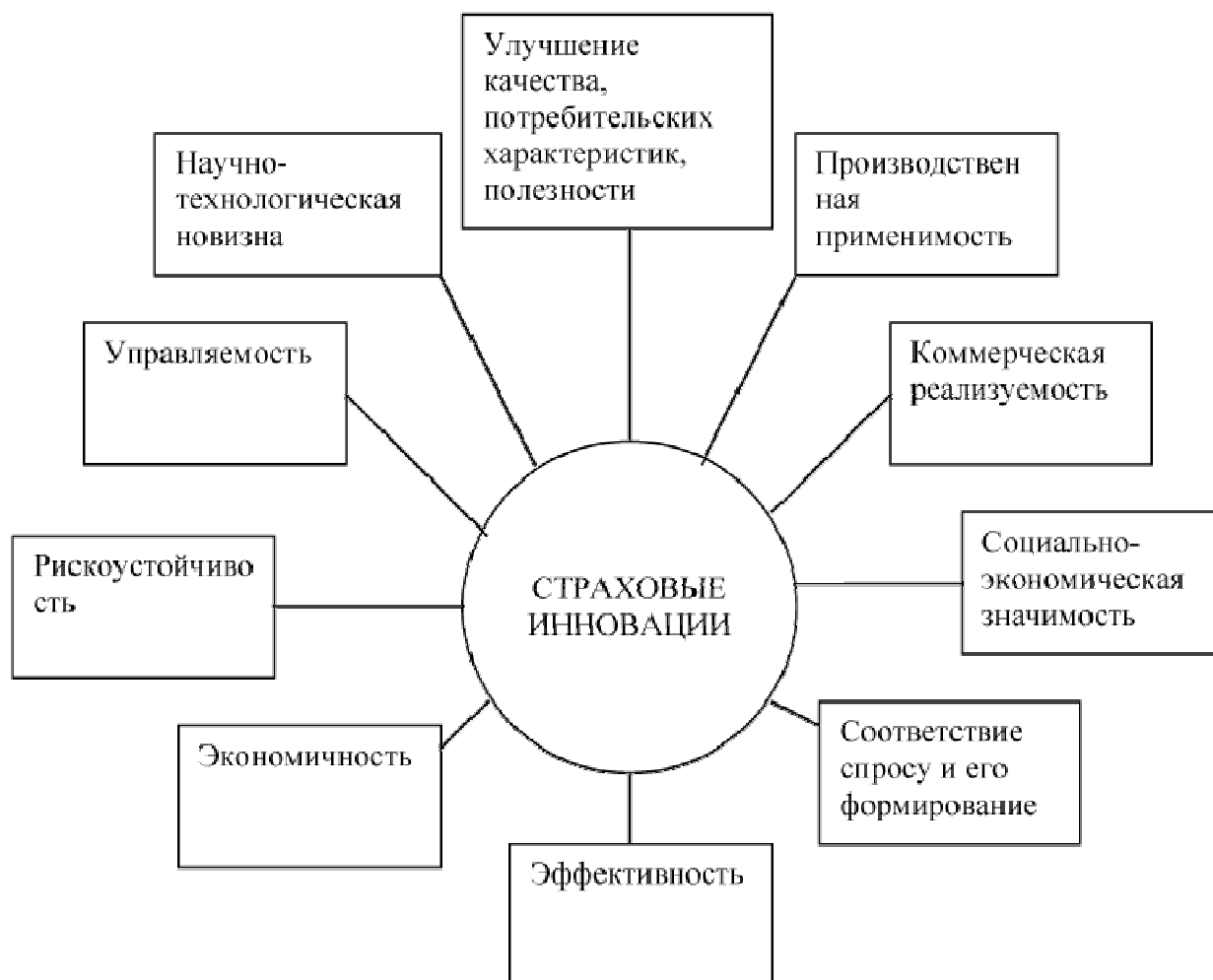
Рис. 2. Характерные черты страховых инноваций

Сущность и содержание инноваций в страховом бизнесе базируются на методологических основах инноватики, учете свойств и функций инноваций, законов и закономерностей инновационных процессов, специфике управления инновационной деятельностью и др. Основные свойства страховых инноваций, их характерные черты представлены на рисунке 2.