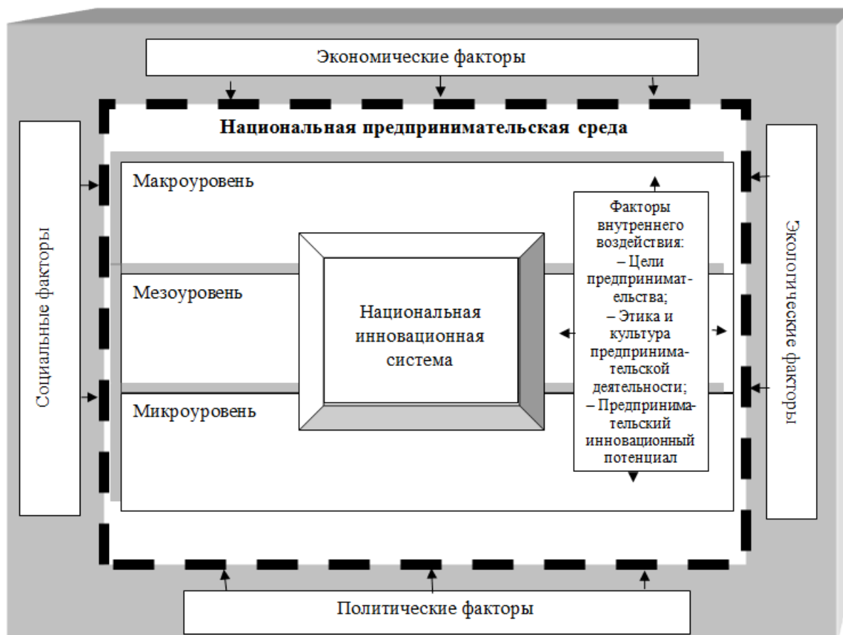
Рисунок 3. Факторы и условия формирования национальной предпринимательской среды

Если предпринимательская структура или система любого масштаба и рода деятельности не будет уделять внимание управлению и развитию инновационных процессов даже небольшое время, то это может привести ее к замедлению развития, снижению эффективности деятельности и даже к полному прекращению функционирования.