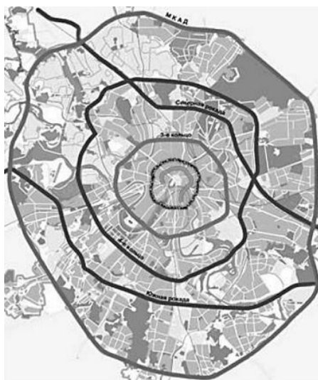
Рисунок 1. План города Москвы

На плане Москвы (рисунок 1) можно увидеть, как она постепенно расширялась, расходясь от Кремля концентрическими кругами. Ближайший к Кремлю полукруг – Китайская стена (сохранилась фрагментарно). Бульварное кольцо, которое состоит из бульваров и городских парков (построено на месте крепостной стены в XVI веке, защищавшее центральную часть Москвы). Следующее кольцо – Садовое, круговая магистраль, состоящая из широких проспектов. Третье транспортное кольцо, расположено на месте бывшего Камер-Коллежского вала (таможенная граница Москвы – 1742 г.). Московская кольцевая автомобильная дорога (с 1960 по 1984 года совпадала с административной границей города).