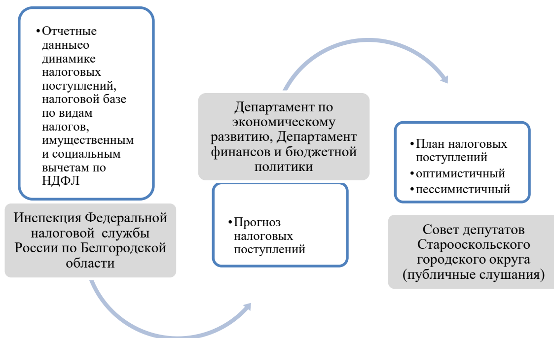
Рисунок 1. Процесс налогового планирования и прогнозирования на территориальном уровне (разработано авторами)

Процесс планирования и прогнозирования бюджетных показателей на уровне территориально образования показан на рисунке 1.