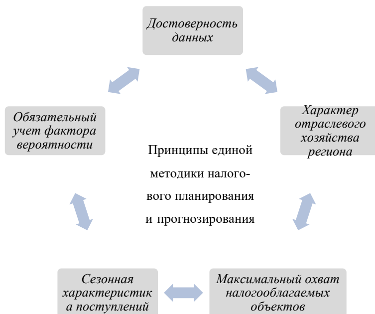
Рисунок 2. Принципы единой методики планирования и прогнозирования налоговых поступлений в бюджетную систему (составлено авторами)

Основные проблемы налогового планирования и прогнозирования на территориальном уровне и возможные варианты их решения представлены на рисунке 3.