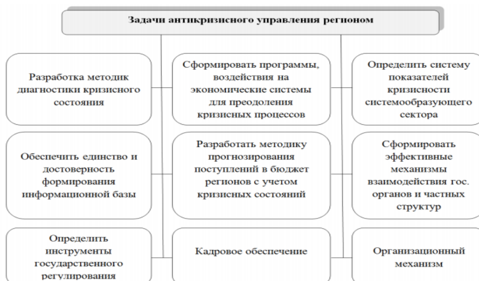
Рисунок 2. Задачи антикризисного управления регионом [5, с. 276]

Касательно к территориальным образованиям, антикризисное управление следует исследовать в четырех курсах: