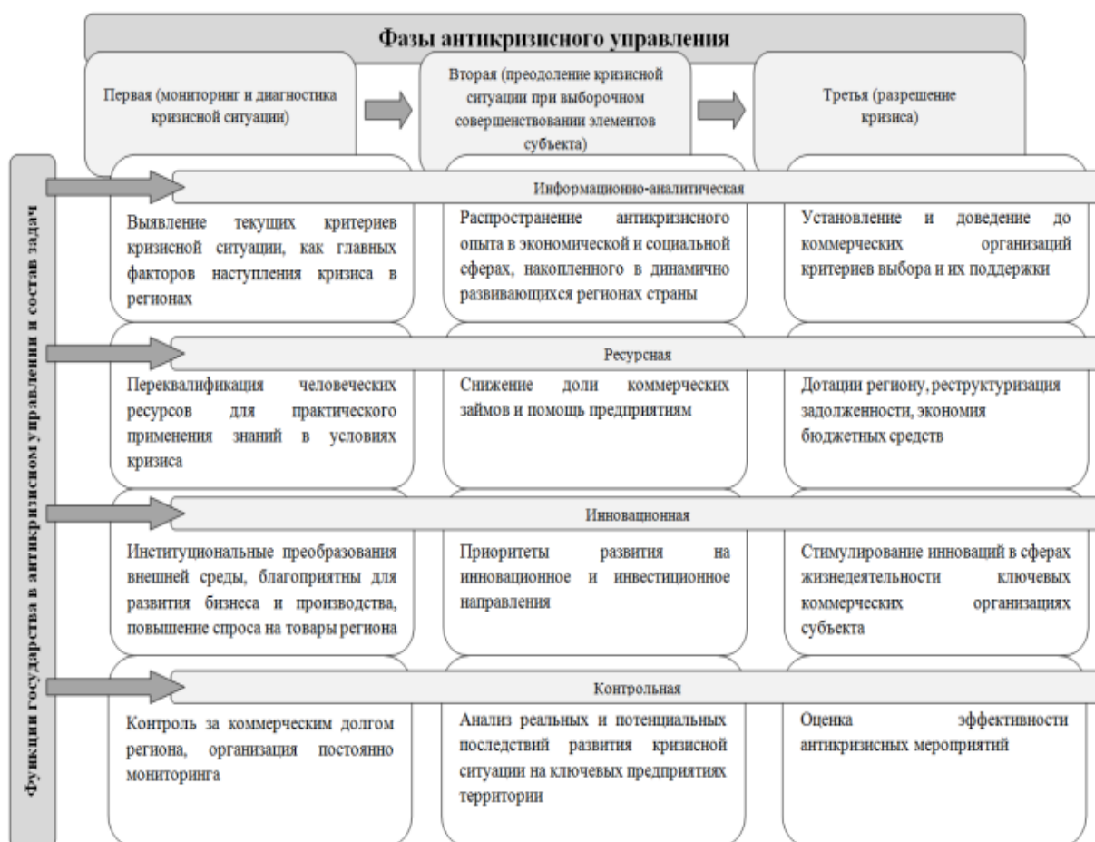
Рисунок 4. Задачи и функции выборочного подхода государства в антикризисном управлении территориями (разработано автором)

К сожалению, государство не может охватить сразу все сферы при наступлении кризисной ситуации, поэтому мы предлагаем выборочный подход при выборе необходимых задач и элементов. Это позволит оперативно и продуктивно справиться с кризисными последствиями. Мы обосновали данные задачи и содержание функций антикризисного управления, распределив их по фазам, и представили это на рисунке 4.