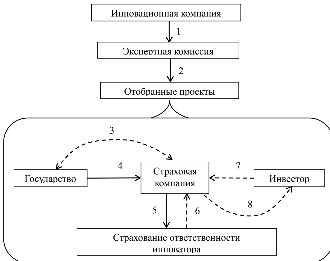
Рис. 2. Модель страхования ответственности инноваторов (разработано авторами)

В качестве схемы взаимодействия страхового рынка, инноваторов, инвесторов и государства можно предложить следующую модель, представленную на рисунке 2.