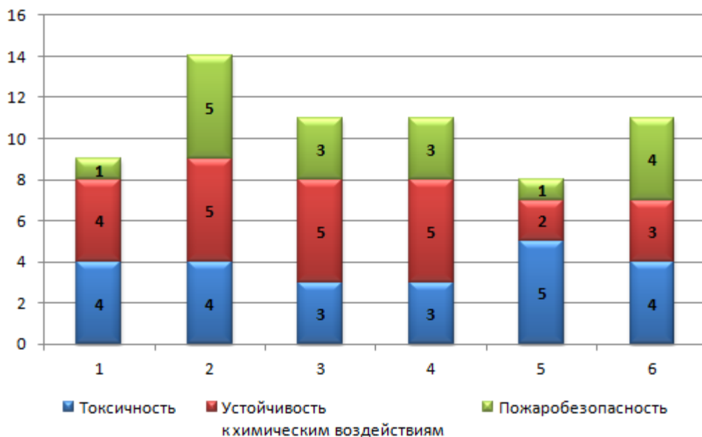
Рисунок 3. Показатели экологичности прозрачных традиционных кровельных материалов: 1 - силикатное стекло; 2 - полиэстер армированный стекловолокном; 3 - поликарбонат монолитный; 4 - поликарбонат сотовый; 5 - акриловое стекло; 6- поливинилхлоридное стекло

Тем не менее, рулонные кровельные материалы из армированного стекловолокном полиэстера не используются при возведении элитных зданий и сооружений, хотя они экономичны с учетом ценовой политики. Технологические особенности устройства кровель из полиэстера армированного стекловолокном с минимальными трудозатратами также позволяют снизить себестоимость возведения зданий и сооружений благодаря низкого коэффициента линейного термического расширения, что позволяет его жёстко крепить к любому каркасу без использования специального крепежа, размерность рулона позволяет покрывать площадь кровли от 100 до 120 м 2 , легкость и армирование материалов не требует создания мощных несущих конструкций.