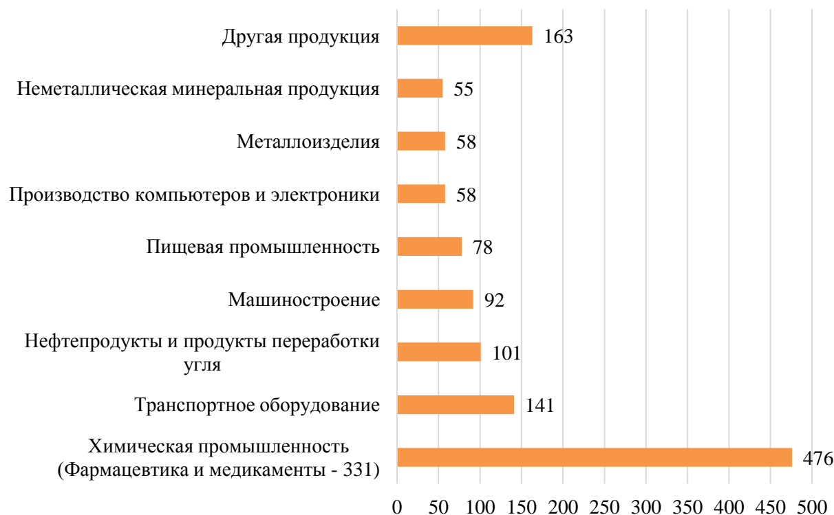
Рисунок 2. Распределение ПИИ по основным видам обрабатывающей промышленности в США в 2015 г. (млрд. долл.)

Чуть подробнее говоря о химической промышленности, стоит отметить, что объем ПИИ в данный вид промышленности более чем утроился с 2010 по 2015 гг., достигнув почти полтриллиона долларов, и показав наиболее высокие темпы роста среди всех иных секторов обрабатывающей промышленности. В рамках химической промышленности наибольшими темпами роста ПИИ отмечались фармацевтическая промышленность и производство медикаментов (рост составил более 270%).