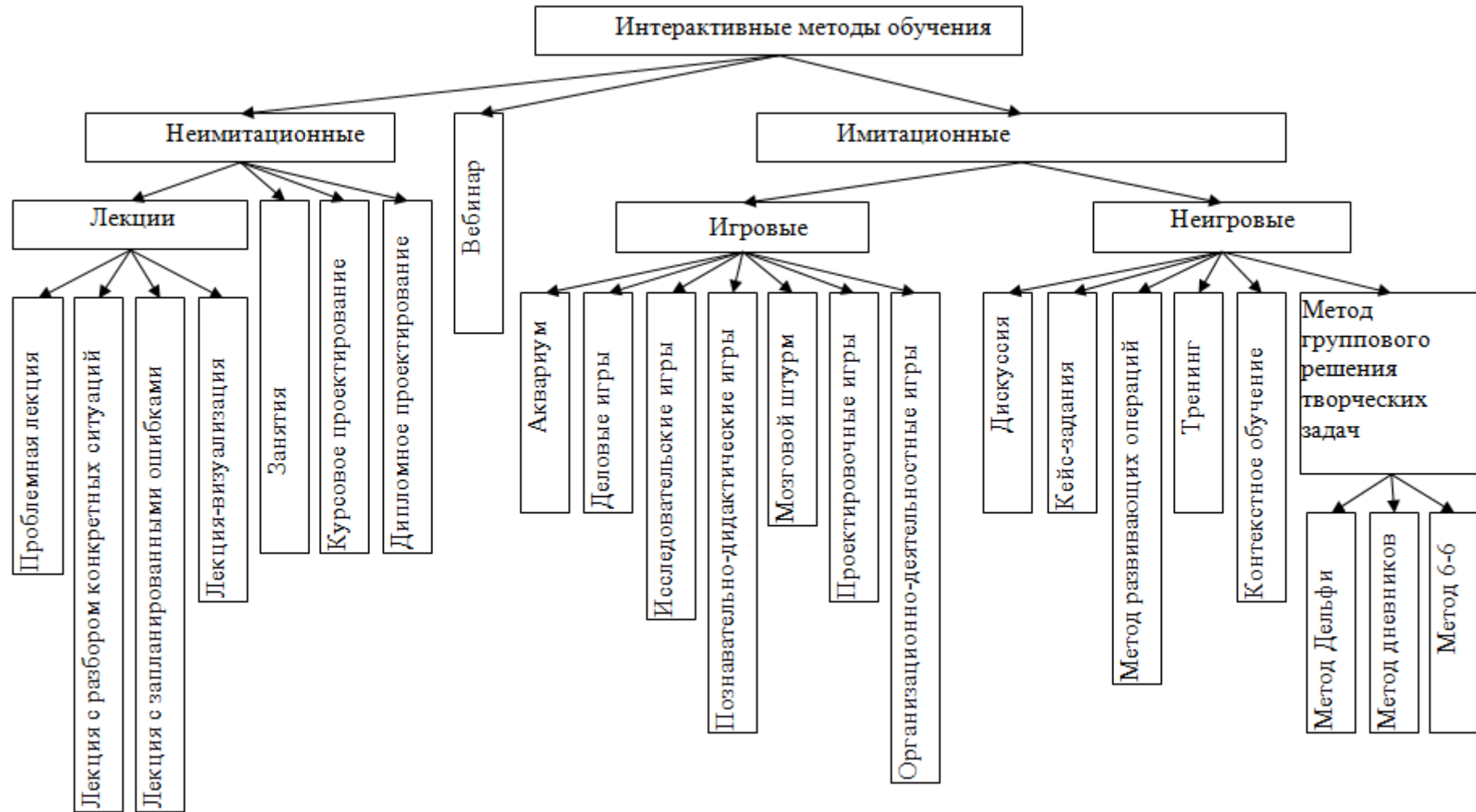
Рис. 4. Интерактивные методы обучения