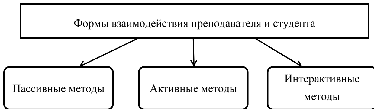
Рис. 1. Формы взаимодействия преподавателя и студентов

Пассивный метод – это форма взаимодействия преподавателя и студента, в которой преподаватель является основным действующим лицом и управляющим ходом занятия, а студенты выступают в роли пассивных слушателей. Связь преподавателя со студентами на пассивных занятиях осуществляется посредством устных и письменных опросов, самостоятельных и контрольных работ и т. д.