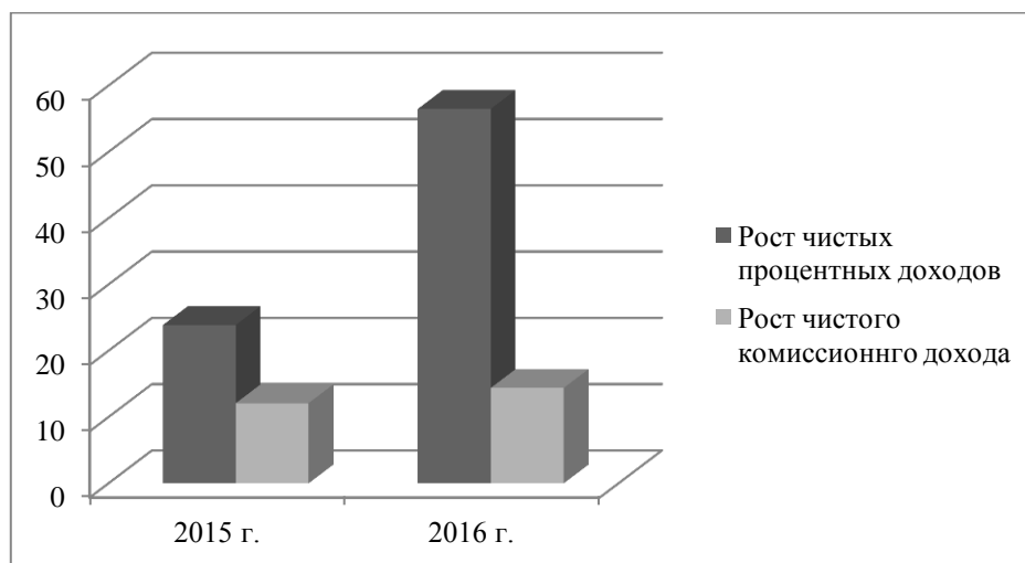
Рисунок 2. Динамика доходности АО «Россельхозбанк» 2 (составлено авторами)

Таким образом, эффективность деятельности кредитных институтов можно рассматривать как финансовые результаты их деятельности, а также как совокупность достигнутых показателей финансового состояния с учетом их целевой значимости. Рассмотрим эффективность деятельности ОА «Россельхозбанк» с помощью показателей чистых процентных и комиссионных доходов (рис. 2).