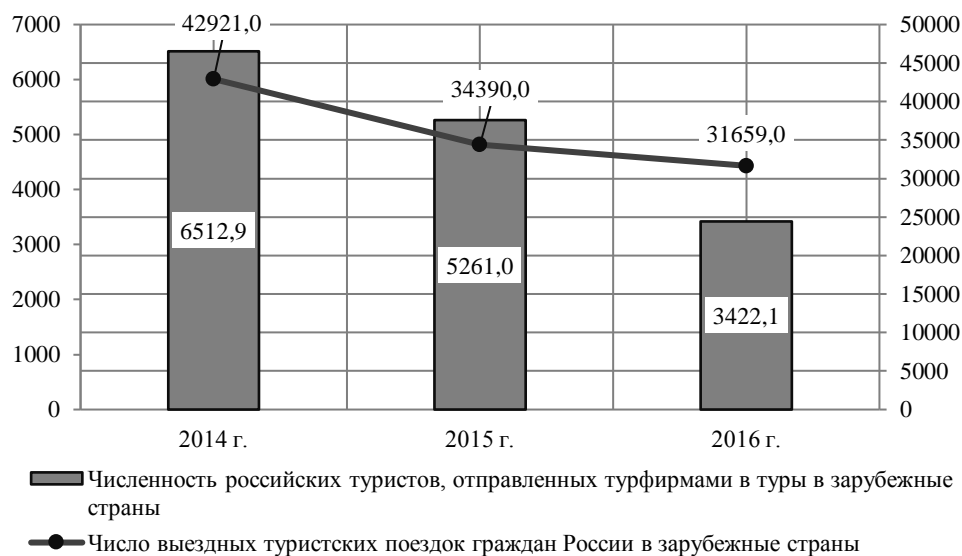
Рисунок 2. Динамика численности туристов, выехавших в зарубежные страны, тыс. чел. (составлено авторами)

Выездной туристический поток из России в 2016 г. по сравнению с 2015 г. сократился на 8 % до 31,66 млн чел. В 2015 г. этот показатель упал почти на 25 % по отношению к предыдущему году 3 . После закрытия Турции и Египта многие туристы выбирали альтернативные направления (самыми популярными направлениями были Абхазия, Финляндия, Казахстан и Китай), в том числе и внутренние, а часть туристов отказалась от поездок из-за нестабильности валюты и вопросов безопасности (рис. 2).