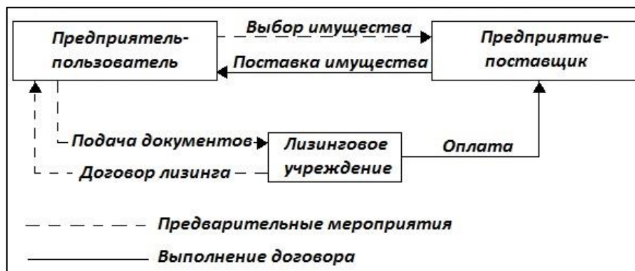
Рисунок 3. Механизм лизинговой операции [3]

Хронологически операция осуществляется следующим образом: выбрав объект и поставщика (без всякого вмешательства лизингового учреждения), будущий арендатор выписывает предварительный счет-фактуру , излагая характеристики оборудования и цену, подает документы лизинговому учреждению, которое после изучения запроса составляет договор, подтверждаемый подписью предприятия-пользователя (рисунок 3) [3].