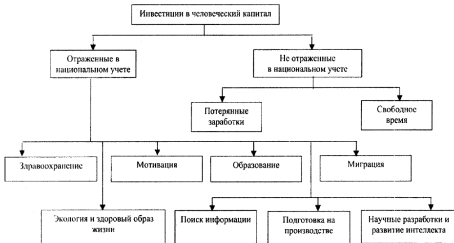
Рис. Инвестиции в человеческий капитал

На приведенном рисунке можно выделить следующие инвестиции: здравоохранение, образование, экология и здоровый образ жизни и объединить их новым понятием – качество жизни.