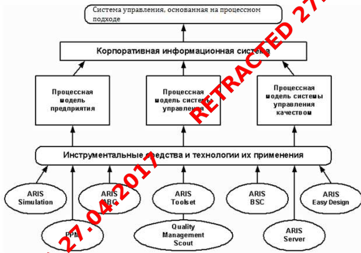
Рис.2. Общий вид системы управления, построенной на процессном подходе к управлению 11

Классические ERP-системы, в отличие от так называемого «коробочного» программного обеспечения, относятся к категории «тяжёлых» программных продуктов, требующих достаточно длительной настройки для того, чтобы начать ими пользоваться. Выбор ERP-системы, приобретение и внедрение, как правило, требуют тщательного планирования в рамках длительного проекта с участием партнёрской компании — поставщика или консультанта. Поскольку ERP-системы строятся по модульному принципу, заказчик часто (по крайней мере, на ранней стадии таких проектов) приобретает не полный спектр модулей, а ограниченный их комплект. В ходе внедрения проектная команда, как правило, в течение нескольких месяцев осуществляет настройку поставляемых модулей.