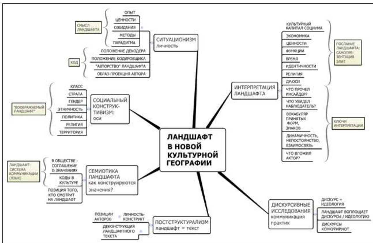
Рис. 1. Направления новой культурной географии (Рисунок выполнен автором на основе работ [14; 17; 27])

Культурный ландшафт рассматривается как воплощение интересов капиталистического строя и соотносимых с ним правящих элит. Морфология ландшафта отражает процессы аккумуляции капитала, а территориальное планирование способствует закреплению инвестиционной привлекательности ареала, его функциональности и «продуктивности». Оно соединяет капитал и символ, жизнеобеспечивающее и экзистенциальное значение ландшафта для местного сообщества, его глубину, эстетику, смысл, с «продаваемым» образом. Трактовка культурного ландшафта как вместилища капитала позволяет понять динамику использования его отдельных локусов. Коммуникационная инфраструктура и объектные системы ландшафта способны как замедлять, так и стимулировать накопление капитала. С изменением способа производства, когда ранее востребованные ареалы становятся загрязненными и истощенными, инвестиции перемещаются в новые ландшафты, либо «работают» на преобразование старых в соответствии с требованиями собственников и элит. Отличительная особенность новой культурной географии – внимание к индивидуальному и групповому сознанию, степени их обусловленности социальным строем. Иными словами, марксистских географов интересует, как капитализм влияет на формирование личности и общества с помощью манипуляций символами и значениями [14].